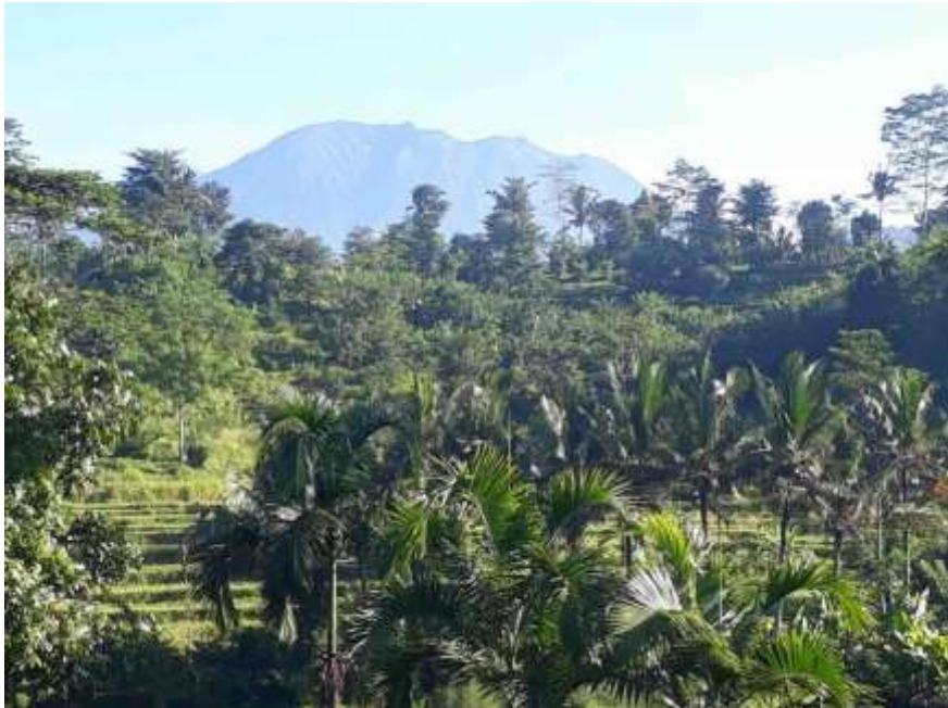
Le Mont Agung, 3.300m, résidence des Dieux à Bali